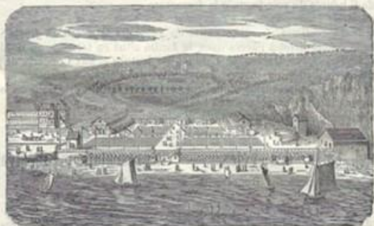
Vue générale du Casino de Fécamp.